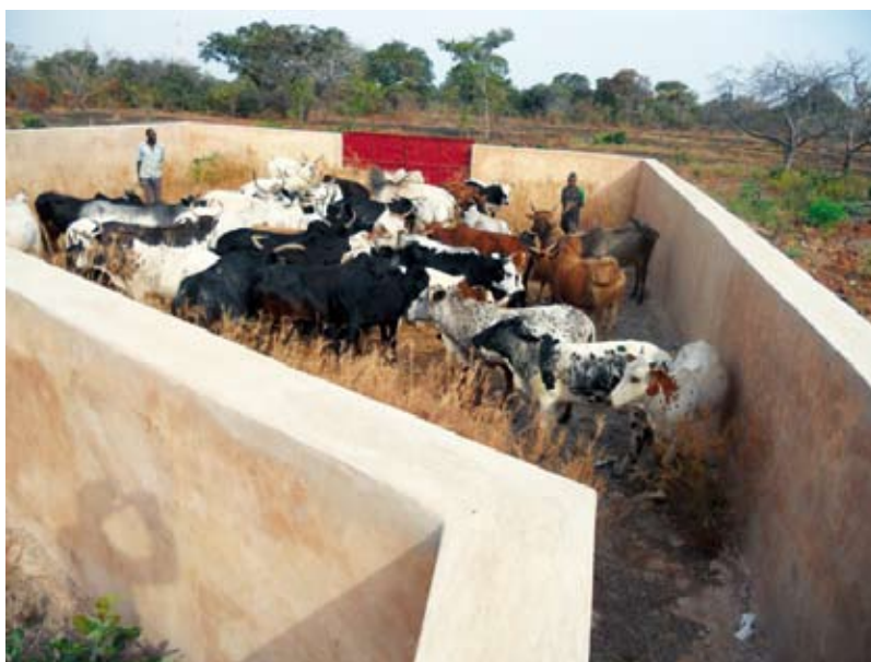
Parc de vaccination de Dembela

Retrouvez le détail de nos actions sur le blog de l'ARCADE http://arcadeactu.canalblog.com/ ou sur la page Facebook de l'association : https://www.facebook.com/arcademali