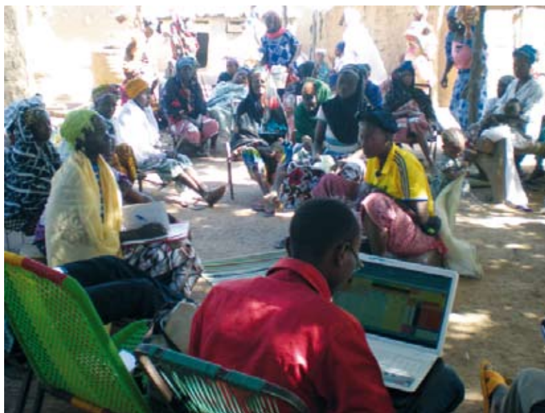
Suivi de gestion des femmes de Niamakouna

Notre équipe au Mali, qui a récemment évoluée pour répondre aux besoins du terrain, a mené ces actions et leur suivi tout au long de l'année, avec l'appui ponctuel des membres français de l'association lors des 3 missions de 2016.