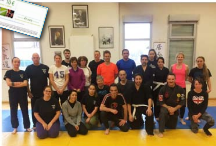
STAGE DE SELF-DEFENSE - 05/12/2018