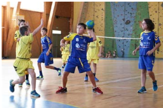
Complexe sportif de la Seytaz

Loisirs (+ 18 ans) Jeudi de 20h30 à 22h30